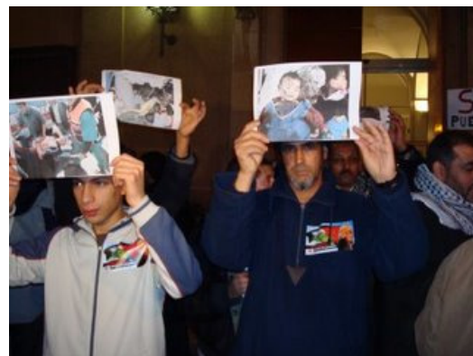
Foto: imagen de la concentración ante la Delegación del Gobierno en Extremadura, en Badajoz.

Más de medio centenar de personas, entre ellos un grupo de palestinos residentes en la región, se concentraron ayer por la tarde ante la Delegación del Gobierno en Extremadura, en Badajoz, para protestar contra los ataques del ejército israelí contra la franja palestina de Gaza. Se congregaron a las siete de la tarde convocados por un grupo de representantes de la Red Ciudadana, y expresaron su protesta con silbidos y gritos tras una pancarta en la que se podía leer el texto "Justicia para Palestina".