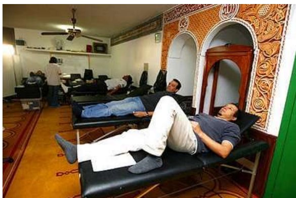
Musulmanes donan sangre en la Mezquita de Ibiza