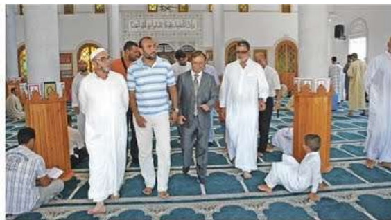
Vivas, en el interior de la mezquita.

CEUTA, 29 /08/ 2009, elpueblodeceuta.es, Gonzalo Testa.