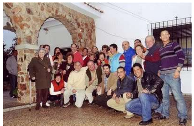
Foto de Convivencia en Don Benito .

Don Benito , 12/02/2010 - Islam Extremadura.