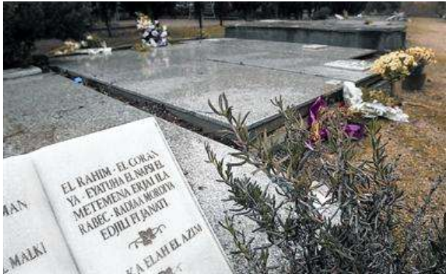
Tumbas en el recinto musulmán del cementerio de Montjuïc, en Barcelona, el pasado 14 de enero.

Ha dejado de resultar una rareza que los servicios funerarios reciban peticiones de familias de credos distintos al católico que reclaman que su pariente sea enterrado en una tumba orientada hacia la Meca, en el caso de los musulmanes, pero también hacia las ciudades israelíes de Jerusalén, si practican el judaísmo, o Haifa, si se trata de seguidores de la Fe Bahá'í. O que la sepultura esté bañada por el sol o mire al mar, cuando el fallecido pertenece a una confesión entroncada con las creencias populares chinas. En cualquiera de esos casos se quiere que el finado sea enterrado bajo tierra y en una zona reservada a los seguidores de sus mismas convicciones religiosas.