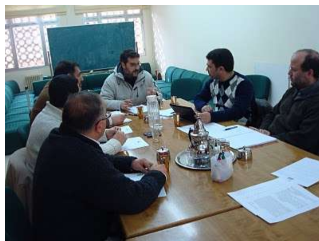
Reunión de la comisión de Cultura e Información

El domingo 14 de febrero de 2010, se han reunido en la sede de la Unión de Comunidades Islámicas de España en la Calle madrileña de Anastasio Herrero número 5, las dos comisiones elegidas por el Consejo Consultivo General de la UCIDE.