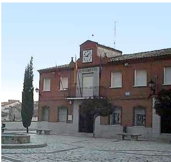
Ayuntamiento de Yuncos

El día 20 de Febrero de 2010 ,la Unión De Comunidades Islámicas De Castilla La Mancha ha celebrado una reunión para el último grupo de comunidades islámicas de Toledo para la justificación de los proyectos de las subvenciones del 2009 de la Fundación Pluralismo y Convivencia.