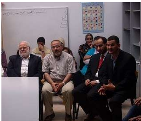
En un acto durante la inauguración de la Mezquita Al Badr de Pamplona

Los responsables de la Comunidad Islámica de Pamplona Mezquita Al Badr , invitaron a la inauguración de la Mezquita ,la mañana del sábado 5 de junio de 2010, a personalidades del Ayuntamiento de Pamplona ,representantes de asociaciones del mundo civil del entorno , y que colaboraban con la comunidad, mediadores sociales, y destacados vecinos del barrio de San Jorge.