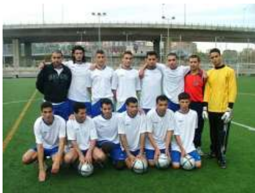
Club deportivo Assalam (Bilbao )