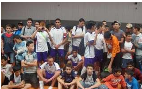
Torneo de Fútbol sala organizado por la Comunidad Islámica de Balaguer

Los días 9,10 y 11 de julio de 2010, se celebra en la Escuela Politécnica Superior de Alcalá de Henares el XXVIII Congreso Islámico de España, bajo el lema "Las sociedades europeas y la participación de los musulmanes : Realidades y retos". Información e inscripción; www.ucide.org