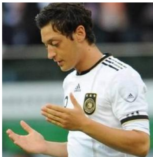
Özil, rezando antes de empezar el partido

Özil expuso su gratitud a su padre, que trabajaba en las minas de hierro ", el quien ha descubierto mi talento futbolístico, y él quien me ha educado y ha insertado en mi la fe religiosa islámica correcta." "Esta educación y formación me ayuda de forma decisiva tanto en la tarea futbolística como en toda mi vida en General" dijo.