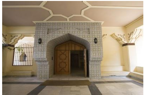
Entrada principal de la Mezquita Central de Madrid - Sede central de la Unión

Se ha reunido la Junta Directiva General de la Unión de Comunidades Islámicas de España en su sede central en Madrid, el viernes, 28.01.2011, con la presencia de todos sus miembros.