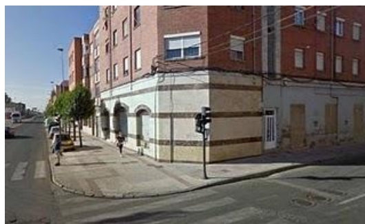
Sede de la Comunidad Islámica de León

Organizada por la Unión de Comunidades Islámicas de Castilla y León, se ha celebrado en la sede de la Comunidad Islámica de León, en la Calle Doctor Fleming, 6 , el sábado 8 de enero de 2011 la Primera Jornada de formación para las comunidades islámicas , bajo el lema “ Las Comunidades Islámicas en Castilla y León: Realidades y Desafíos”