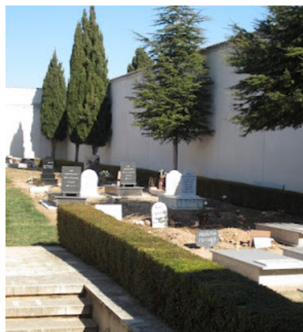
Cementerio musulmán de Valencia

El presidente de la Unión de Comunidades Islámicas de España (Ucide), Riay Tatary, ha reclamado más cementerios musulmanes en España --cuentan con doce en todo el país-- para no tener que repatriar los cadáveres, algo que resulta muy costoso, más en esta época de crisis, ya que el coste puede ascender hasta los 6.000 euros, dependiendo del país de origen.