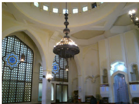
Mezquita Central de Madrid

Se ha reunido la Junta Directiva General de la Unión de Comunidades Islámicas de España en su sede central en Madrid, el sábado, 30.06.2012, con la asistencia de todos sus miembros.